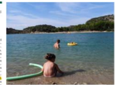
Bañistas en la playa de interior de Ardales

Además, otra parte de interés es que, junto a este entorno natural, podemos disfrutar en los alrededores turísticos del Camping Parque Ardales de gestión municipal. Los visitantes disfrutamos servicios de hostelería, gastronomía y ocio que nos permiten pasar un día perfecto para vacaciones, familias de amigos o grupos de recreo que desearan con la familia o