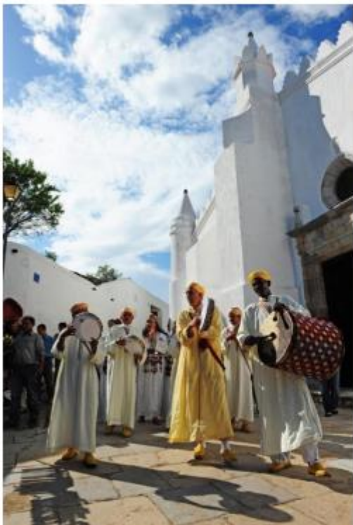
Turismo Cultural & Eventos