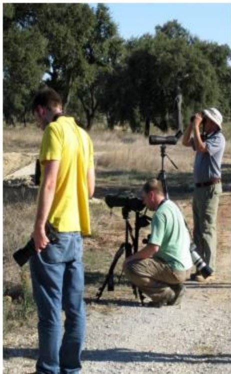
Turismo de Natureza Birdwatching << Walking >> Cycling Astroturismo << Geoturismo <<