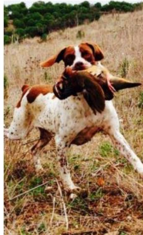
Turismo Cinegético Mértola, Capital Nacional da Caça