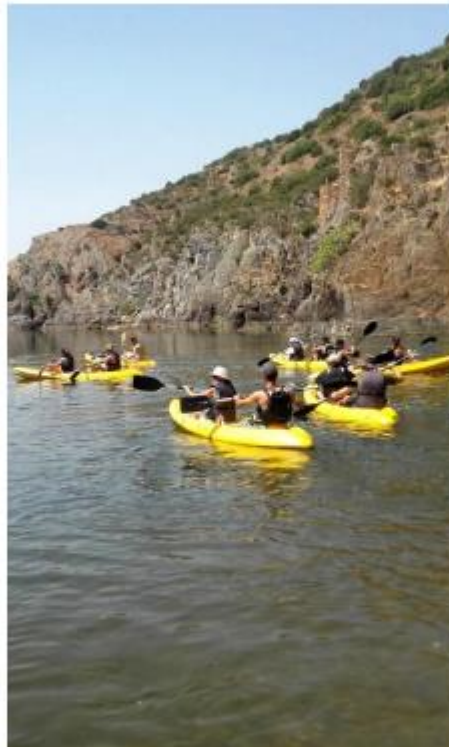
Turismo Náutico Recreativo e Desportivo (Pista Internacional de Canoagem)