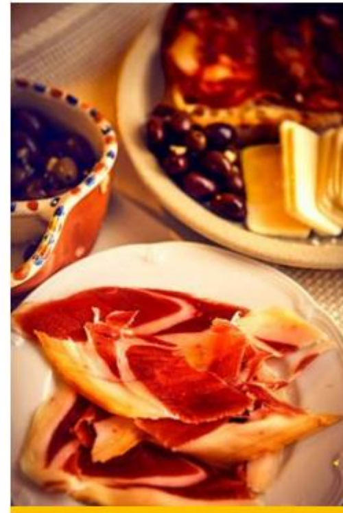
Gastronomia Restauração Enoturismo