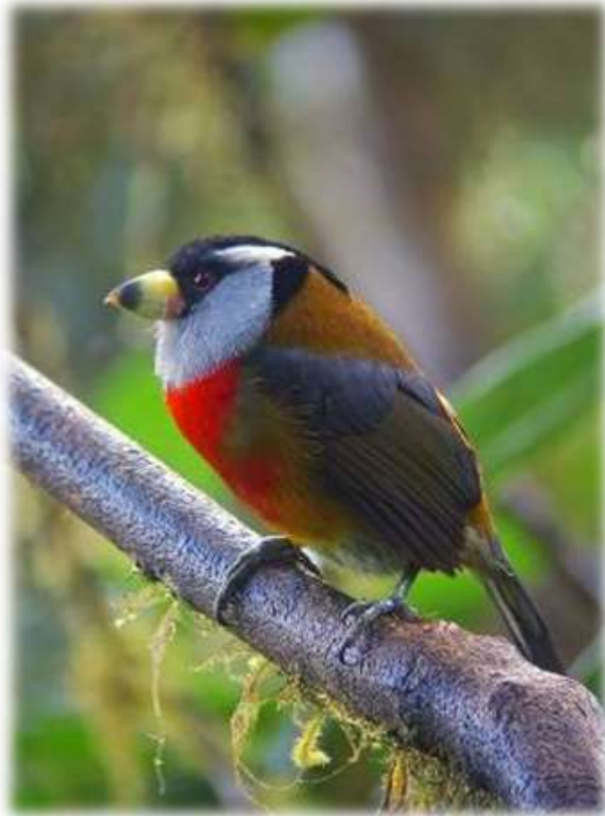
Toucan barbet- Pájaro yumbo

Ecuador se ha posicionado con reconocimiento mundial